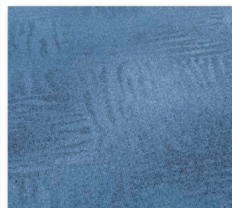
400+500 cm 75