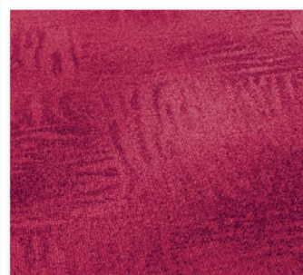
400 cm 16