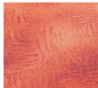
400+500 cm 64