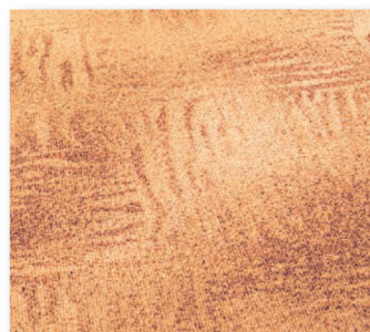
400+500 cm 33