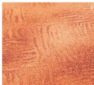
400+500 cm 53