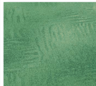
400 cm 23