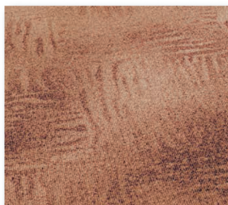
400 cm 46